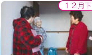
社協古池ささえあい

支え合いマップをもとに、支部福祉委員がふれあいいきいきサロンに参加されていない高齢者のお宅へ贈り物を持って安否確認を兼ね訪問しました。