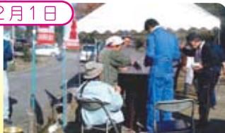
竜泉町自治会ふれあい祭

地域住民でついた餅を持って行事に参加できない高齢者宅を訪問。共同募金箱を設置したが、当日持ち合わせのなかった人が後から持参してくださり心が温かくなりました。