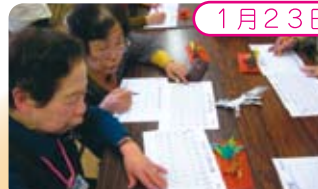
新春お楽しみ“ビンゴ”大会

ふれあいいきいきサロンに歩いて行くことが難しい高齢者へ訪問。「お元気ですか」の声かけは非常に喜ばれました。