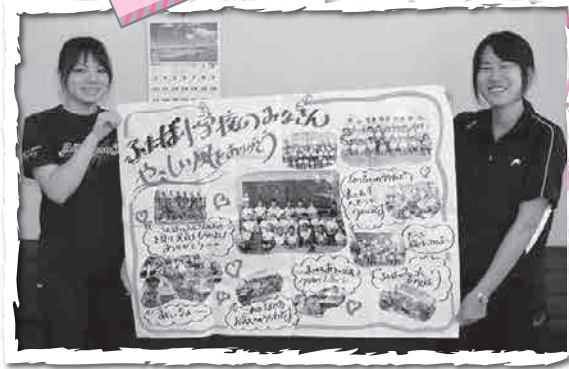
山西小学校から届けられたお礼のメッセージ

相生小学校と双葉小学校の全校児童が、被災地の子どもたちを励まそうと、熊本県西原村立山西小学校へ手作りうちわ500柄を届けました。うちわには、児童一人ひとりが被災地の子どもを思いうかべながら、思い思いの言葉や絵を書きました。7月末には、各小学校にお礼の手紙やメッセージが届けられ、手づくりうちわを通じて学校や子どもたちのつながりができました。