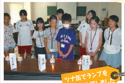
ツ十缶でランプを 作り、火を灯しました