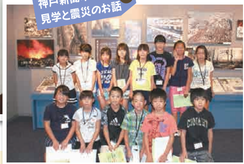
神戸新聞本社の 見学と震災のお話