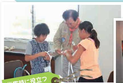
災害時に役立つ ロープの結び方

今年のジュニアボランティアスクールには 相生市内の小学4年生から6年生まで15名が参加しました。