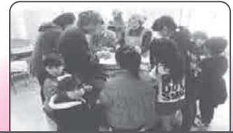
歳末・三世代ふれあい餅つき

こどもの参加が多く、高齢者との交流が出来て最良でした。また、出来たお餅を一人暮らしの高齢者宅などに配り「今年もありがとうございます」と感謝の言葉を頂きました。地域の絆がより一層深まりました。