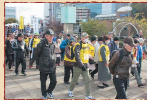
災害にも強い地域づくり研修