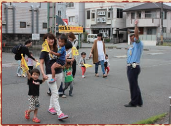
まちの子育てひろば