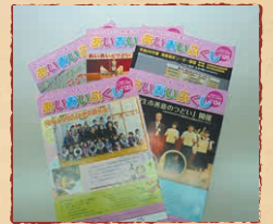
社協だよりの発行