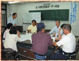
地域福祉リーダー研修