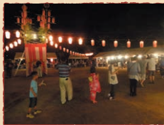
ふれあい活動助成金 (古池・向陽台支部)