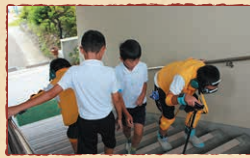
高齢者疑似体験 (若狭野小学校)