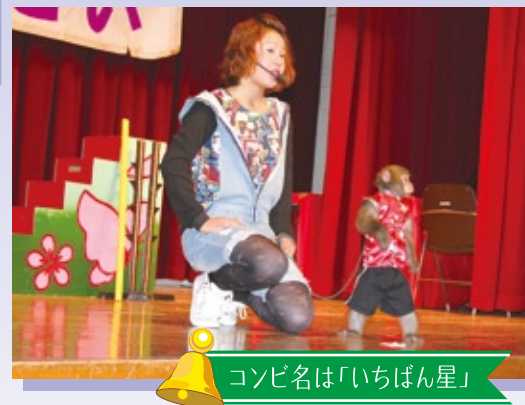
コンビ名は「いちばん星」