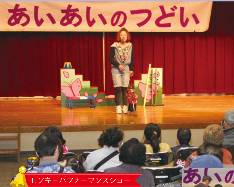
モンキーパフォーマンスショー