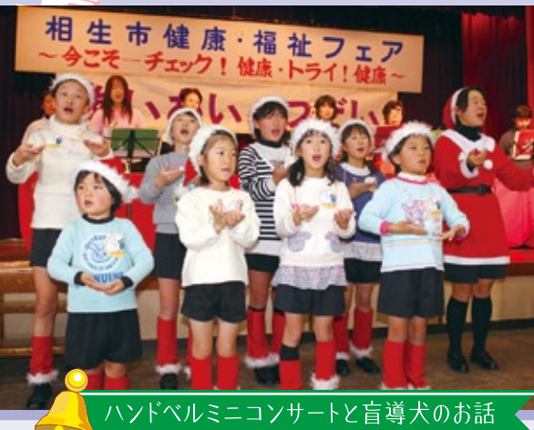
ハンドベルミニコンサートと盲導犬のお話