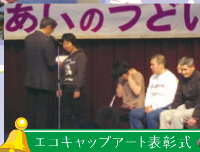
エコキャップアート表彰式