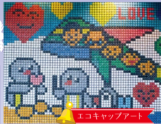
エコキャップアート