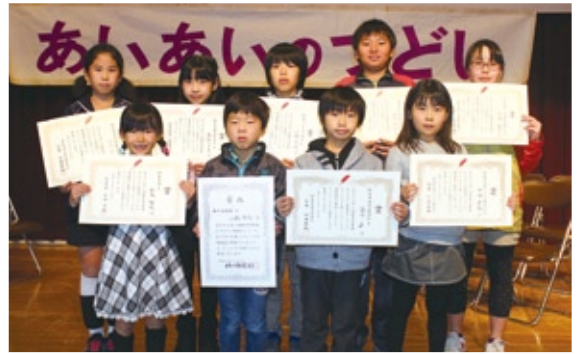
表彰式 (あいあいのつどいにて)