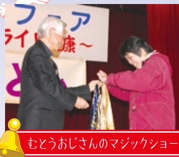
むとうおじさんのマジックショー