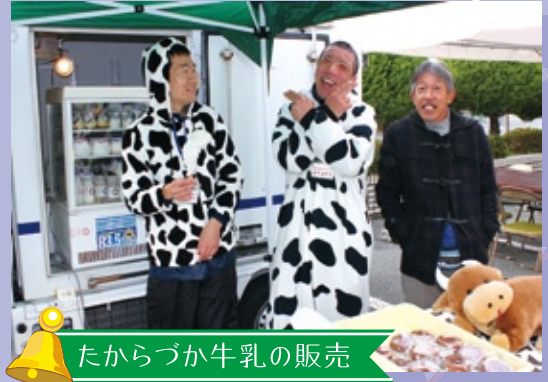
たからづか牛乳の販売