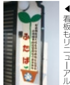
◀看板もリニューアル

小規模多機能型居宅介護事業所「ふたば」の増改築工事が終了しました。登録定員数は20名から25名へ、泊まりは5名から9名へ増えました。介護保険の認定を受けておられる方に、「通い」「泊まり」「訪問」のサービスを柔軟に組み合わせて提供し、ご自宅での生活を支援します。ご利用について、お気軽にご相談ください。