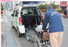
車いす利用者の移送サービス事業