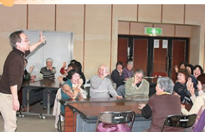
地域福祉リーダー研修