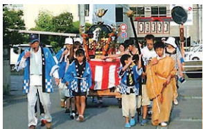
地域ふれあい活動助成金 (旭地区 秋祭り)