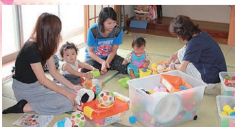
まちの子育てひろば