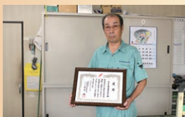
(株)山陽高周波工業所様