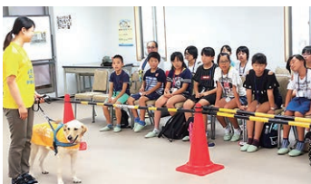
ジュニアボランティアスクール