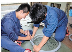
相産業高校 (空飛ぶ車いす修理ボランティア)