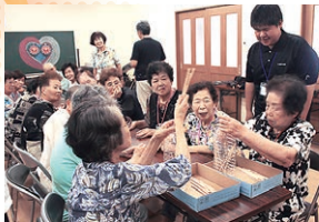
ふれあいいきいきサロン