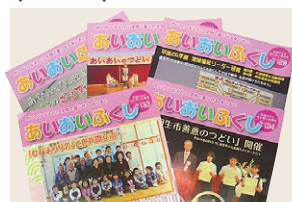
社協だよりの発行