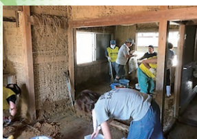
災害救援ボランティア活動