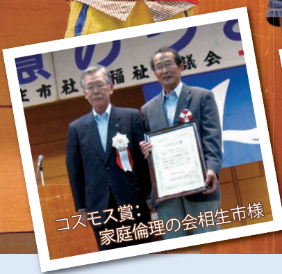
コスモス賞： 家庭倫理の会相生市様