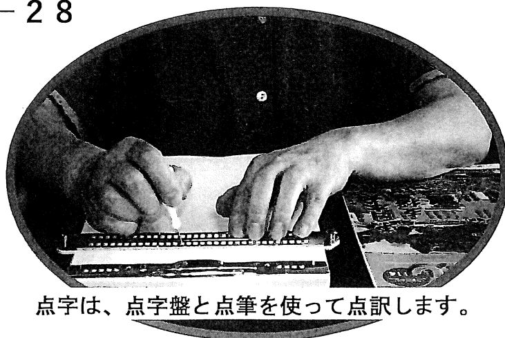
点字は、点字盤と点筆を使って点訳します。

会場 相生市立総合福祉会館 ボランティアセンター (3階) 相生市旭1丁目6-28 講師 相生点灯会 定員 10名 参加費 無料 締切 11月10日(木)